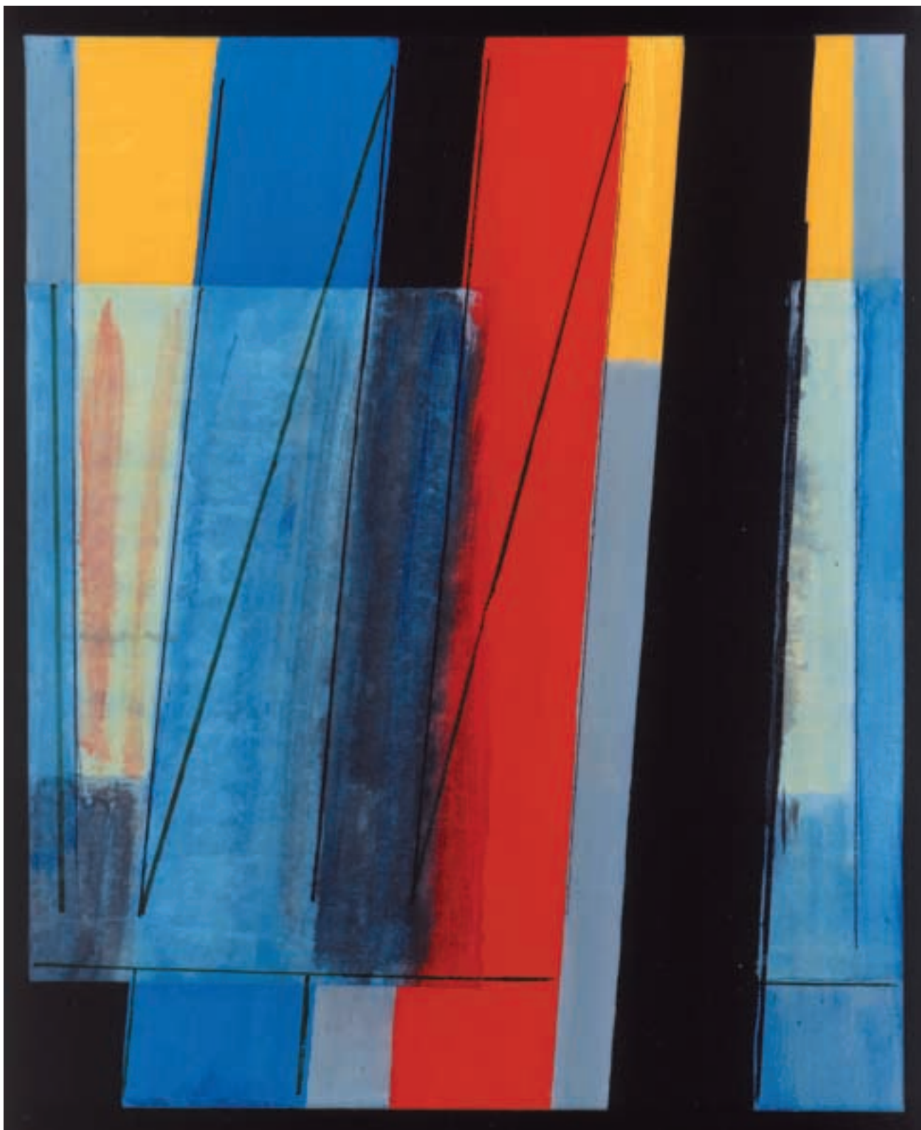
Obraz 236 / Immagine 236 / Painting 236 / acrylic on canvas