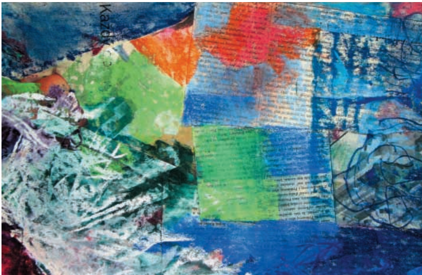
Město II. / Città II. / A new City II. / detail, pastel