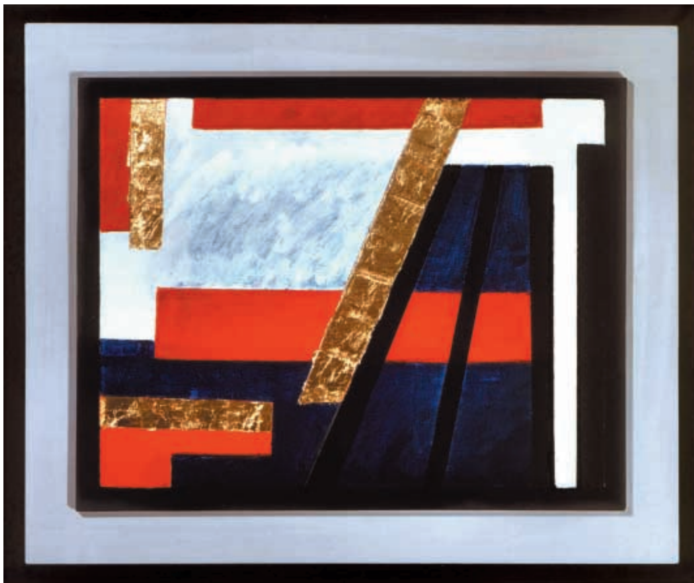
Obraz 231 / Immagine 231 / Painting 231 / acrylic and gold on canvas