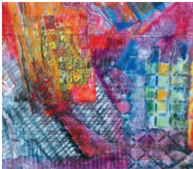
Město III. / Città III. / A new city III. / detail, pastel