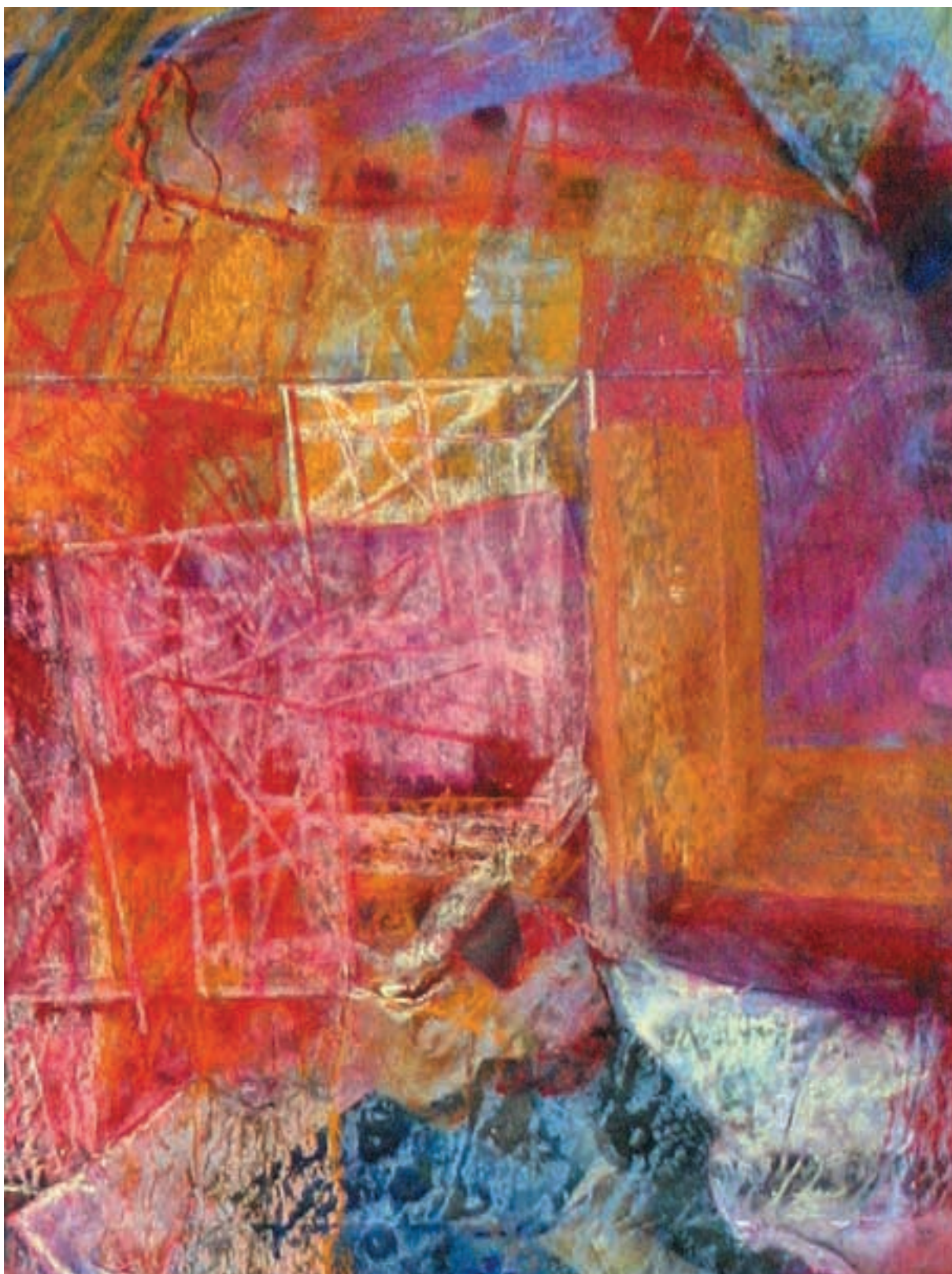
Město / Città / A new City / detail, pastel