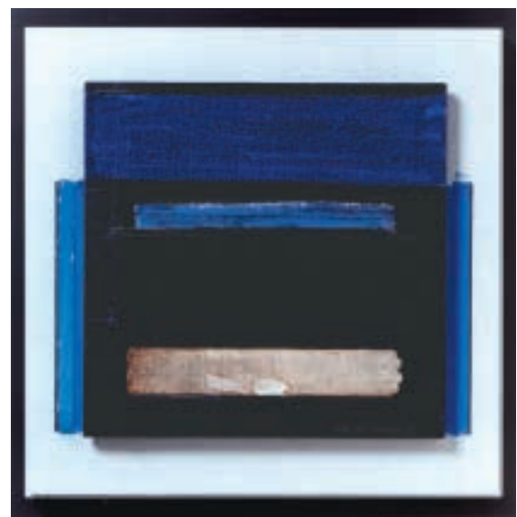
Reliefbild - Freyung 16 acrylic and gold on wooden panel

(Teile der Ansprache von Prof. Otto Herbert Hajek, Eröffnung Kulturzentrum Otto Herbert Hajek, Prachatice, Süd Böhmen, 27. Juni 2001)